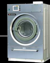
支持热水洗涤的水洗机