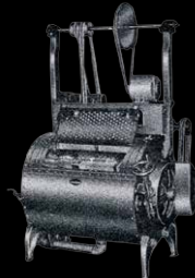
山本式普通型水洗机