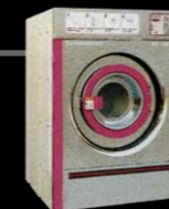
投币式自助洗衣店用水洗机